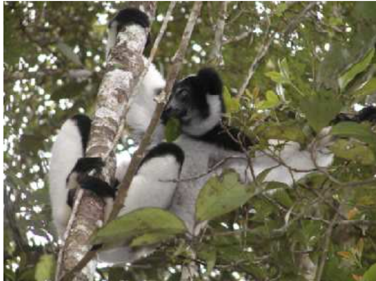
Ny Babakoto amin'ny faritry Andasibe dia fotsy be.

Ny vaviny no mandidy-manapaka ny tokantrano mihoatra ny lahy, ary izy mihinana voalohany izikoa misy sakafo pare! Ny babakoto tsy mitady vady hafa izikoa tsy efa maty ny vady taloha.