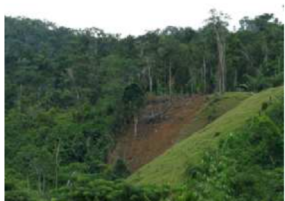
Ny tevyala amin'ny faritra Makira.

Ny loza mitatao amin'ny ankoma sady amin'ny biby sy ny zava-maniry samihafa eto Madagasikara, dia ny doron-tanety sy ny fandripahana atiala tsy voatagna hoan'ny famboliagna. Na ny fihazagna komba anatin'ny atiala voaharo karaha ny faritra Makira.