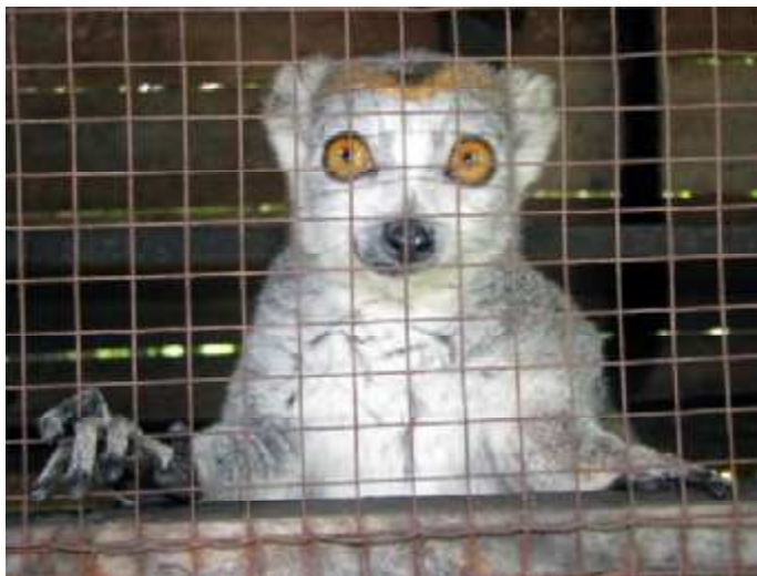
Mbola misy olona ratsy fanaha mitarimy ankomaba karaha Eulemur coronatus ity an'tranonjareo. Ankomba tokony mipetraka anaty ala fa tsy an'tanana!

Hatramin'ny izao, na efa nisy fampianarana maro momba ny tontolo iainana, aza ezaka mafy natao ny WCS Makira, na ny ANGAP, mbola misy olona ratsy foana, anatin'ny faritra Sambava ndraiky Andapa ndraiky Maroantsetra, mitarimy ankomba an'trano anaty vala!