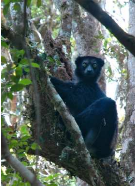
Ny Babakoto amin'ny faritry Makira dia mainty be.

Ny babakoto dia karazana komba farany kay kanefa mbola misy sady tsy miova endrika teto ambony tany hatramin'ny izao. Ny babakoto dia karazana biby “primate” zany hoe mitovy karazana sy fomba amin'ny olona.