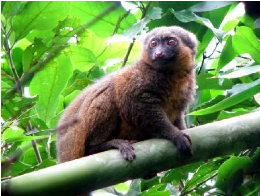
Karazam-bokombolo mitovitovy amin' nintsika anaty ala amin' ny faritry Parc Nationale Ranomafana/Fianrantsoa, Haplemur aureus .

Isaka andiam-bokombolo mitaky atiala eo ho eo dimy ambin' ny folo hatramin' ny roapolo hekitara, arakaraka ny afontriran' ny valiha ampy hahavoky azy anatin' ny faritry.